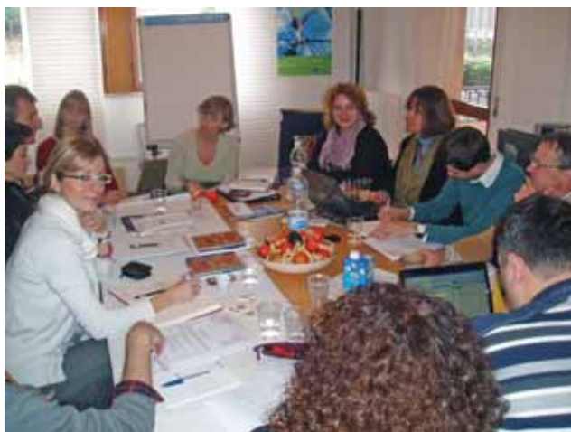
SASTANAK PREDSEDNIKA AGENCIJA LOKALNE DEMOKRACIJE, VICENZA 2010. / MEETING OF LOCAL DEMOCRACY AGENCIES' PRESIDENTS, VICENZA 2010