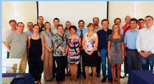
SASTANAK UPRAVLJAČKOG ODBORA PROJEKTA MIKREKREDITIRANJA U TIRANI / STEERING COMMITTEE MEETING OF MICRO-CREDIT PROJECT IN TIRANA

Local Economical Development (2004-2005)