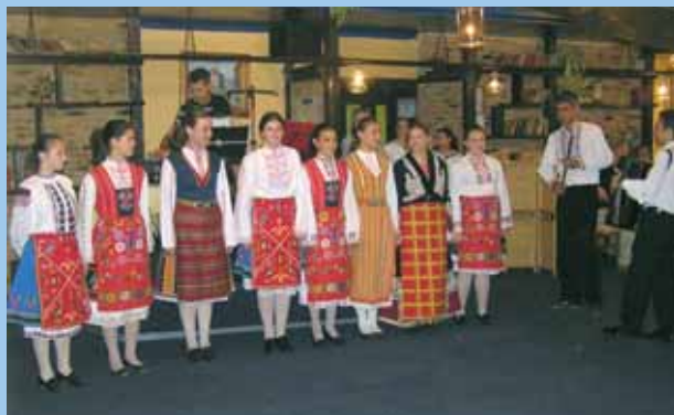
ZAVRŠNA KONFERENCIJA RIME PROJEKTA, BUGARSKA / FINAL CONFERENCE OF RIME PROJECT, BULGARIA