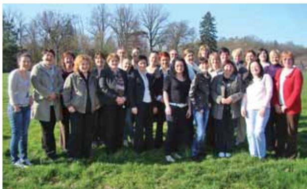
TRENING ZA ŽENE LIDERICE, PROJEKT JAČANJE LOKALNE DEMOKRACIJE / TRAINING FOR WOMEN LEADERS, PROJECT ENABLING LOCAL DEMOCRACY