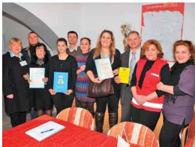
NAGRADA VOLONTERKI ALD SISAK ZA VOLONTERA GODINE, SISAK 2010. / VOLUNTEER OF THE YEAR AWARD TO LDA SISAK VOLUNTEER, SISAK 2010