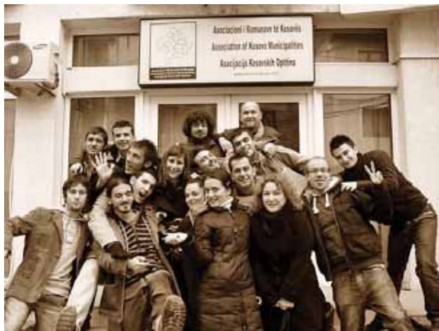
TRENING ZA MLADE NA KOSOVU, 2009. / TRAINING FOR KOSOVO YOUTH, 2009