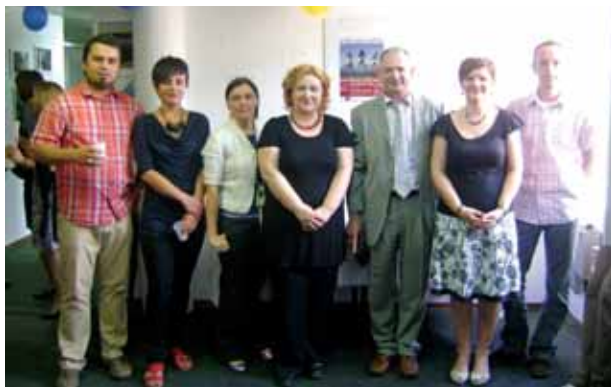
OTVARANJE VOLONTERSKOG CENTRA SISAK / OPENING OF LOCAL VOLUNTEER CENTRE SISAK

Program „Kultura i ljudska prava“ obuhvaća projekte kojima je cilj zaštita i promocija ljudskih prava u najširem smislu, poboljšanja kvalitete življenja te razvoja kulturne suradnje kroz našu partnersku mrežu. U okviru ovog programa osnovana je prva besplatna telefonska linija za žrtve obiteljskog nasilja u Sisačko-moslavačkoj županiji te prva grupa volontera u Hrvatskoj koji se bave klaunoterapijom, grupa SKLAUN.