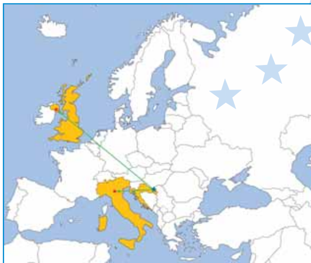
MREŽA PARTNERA ALD SISAK NETWORK OF LDA SISAK PARTNERS