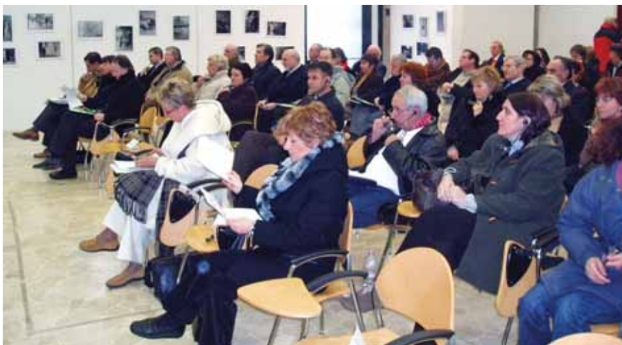
PLANIRANJE RADA ALD SISAK ZA SLIJEDEĆU DEKADU, MOGLIANO VENETO 2007. / LDA SISAK PLANNING FOR NEXT DECADE, MOGLIANO VENETO 2007