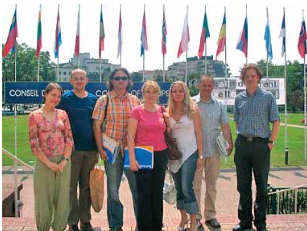
SISAČKI NOVINARI U VIJEĆU EUROPE, 2006. / JOURNALIST FROM SISAK IN COUNCIL OF EUROPE, 2006