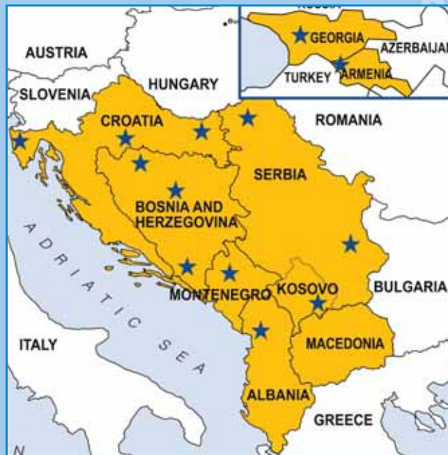
MREŽA AGENCIJA LOKALNE DEMOKRACIJE / NETWORK OF LOCAL DEMOCRACY AGENCIES

Local Democracy Agency Sisak see its strong role even after Croatia enters the European Union since then we are facing new challenges and upgrading of the common goal - maintaining peace and building a stabile Europe.