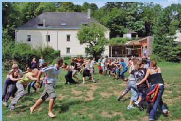
MEĐUNARODNA RAZMJENA MLADIH U AUSTRIJI / INTERNATIONAL YOUTH EXCHANGE IN AUSTRIA

Young People and Civil Society - A Step to the Common European Values (2008)