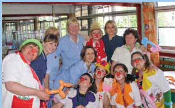
POSJET KLAUNOVA VOLONTERA SISAČKOJ BOLNICI / CLOWNS VOLUNTEERS VISITING SISAK HOSPITAL