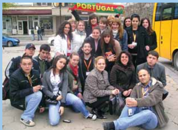
MEĐUNARODNA RAZMJENA MLADIH U BUGARSKOJ / INTERNATIONAL YOUTH EXCHANGE IN BULGARIA