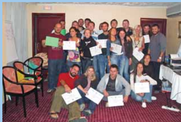
MEĐUNARODNI TRENING ZA MLADE U SISKU / INTERNATIONAL YOUTH TRAINING IN SISAK