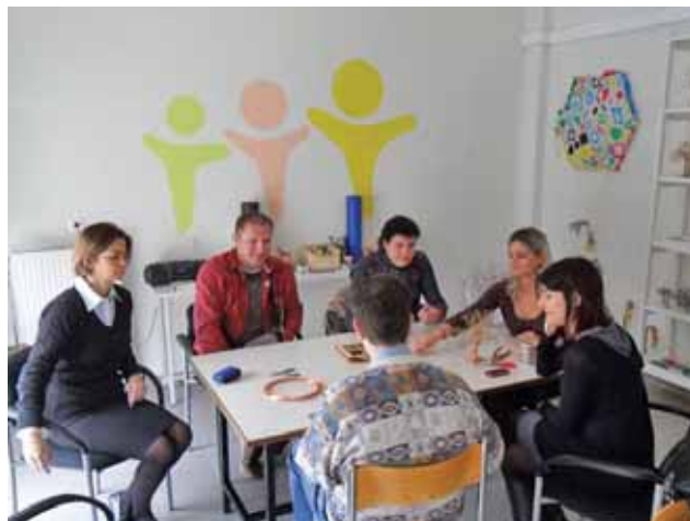
STUDIJSKA POSJETA NAŠIH VOLONTERA ORGANIZACIJI KMOP u GRČKOJ / OUR VOLUNTEERS VISITING ORGANISATION KMOP IN GREECE