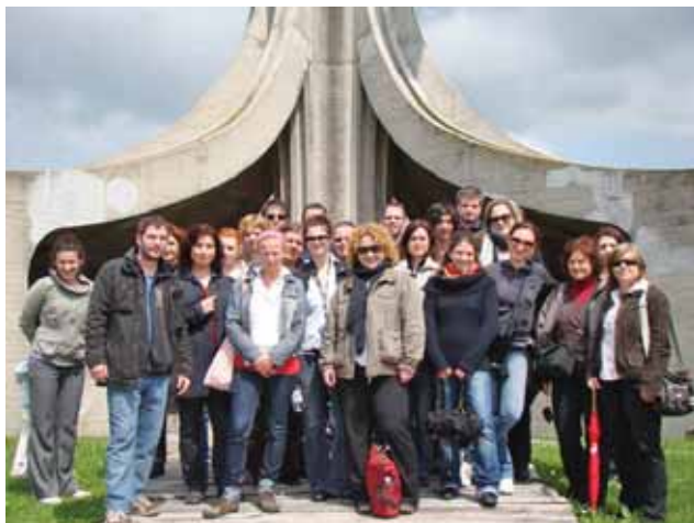
POSJET GRAĐANA SPOMEN PODRUČJU JASENOVAC / CITIZENS VISITING MEMEORIAL SITE IN JASENOVAC