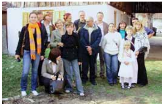
OTVARANJE ETNO KUĆE U HRVATSKOJ DUBICI / OPENING OF ETHNO HOUSE IN HRVATSKA DUBICA

Suradnja mladih i umrežavanje u sklopu partnerstva Agencija lokalne demokracije - Potpora ciljevima kampanje Svi različiti-Svi jednaki (2006.)