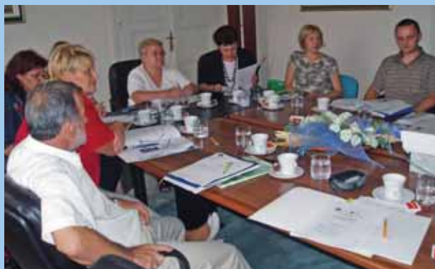
MEĐUSEKTORSKA RADNA GRUPA ZA SMANJENJE OBITELJSKOG NASILJA / INTER- SECTOR WORKING GROUP FOR PREVENTION OF DOMESTIC VIOLENCE