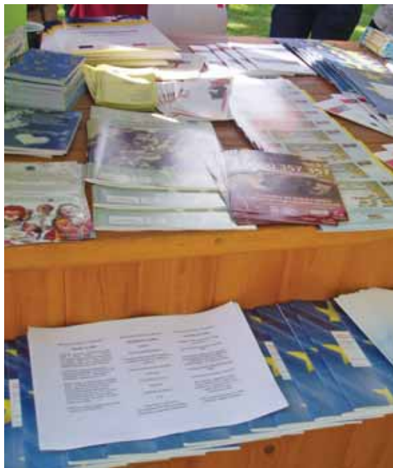
ŠTAND ALD SISAČ, OBILJEŽAVANJE DANA EUROPE U SISKU / LDA SISAČ STAND, DAY OF EUROPE CELEBRATION IN SISAČ

ALD Sisak pruža usluge edukacije, konzultacije i facilitacije u područjima svog djelovanja za sve zainteresirane, osobito u izgradnji kapaciteta, organizacijskog razvoja, strateškog planiranja, pisanje projekata, ljudskih prava, mladi, aktivnog građanstva, umrežavanja, partnerstva i suradnje. Usluge su prilagođene za pojedinu ciljanu skupinu i krojene po potrebama naručitelja. Ukoliko imate potrebu za našim uslugama, kontaktirajte nas i rado ćemo odgovoriti.