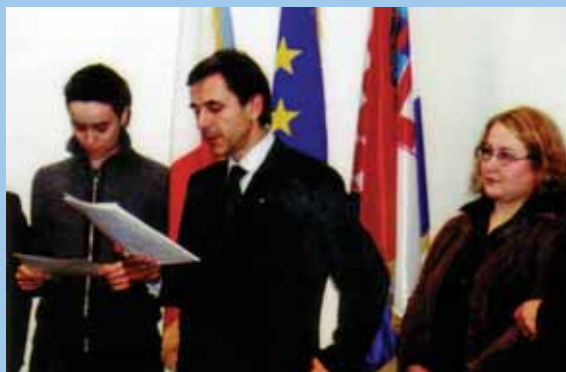
PRIMANJE NAGRADE REPUBLIKE FRANCUSKE ZA PROMOVIRANJE LJUDSKIH PRAVA MEĐU MLADIMA, 2004. / RECEIPT OF REPUBLIC OF FRANCE AWARD FOR PROMOTION OF HUMAN RIGHTS AMONG YOUNG PEOPLE, 2004

LDA Sisak is providing services of education, consultation and facilitation in the area of its work for all interested stakeholders, especially in capacity building, organisational development, strategic planning, project designing, human rights, youth, active citizenship, networking, partnership and co-operation. The services are adjusted to every target group and tailored made to the needs of the ordering party. If you are interested in any of our services, please contact us and we will gladly reply.