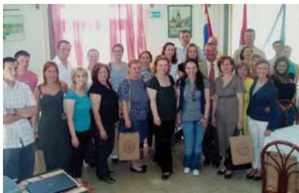
STUDIJSKA POSJETA HRVATSKOJ KOSTAJNICI, PROJEKT INTACT / STUDY VISIT IN HRVATSKA KOSTAJNICA, INTACT PROJECT

Program „Kultura i ljudska prava“ obuhvaća projekte kojima je cilj zaštita i promocija ljudskih prava u najširem smislu, poboljšanja kvalitete življenja te razvoja kulturne suradnje kroz našu partnersku mrežu. U okviru ovog programa osnovana je prva besplatna telefonska linija za žrtve obiteljskog nasilja u Sisačko-moslavačkoj županiji te prva grupa volontera u Hrvatskoj koji se bave klaunoterapijom, grupa SKLAUN.