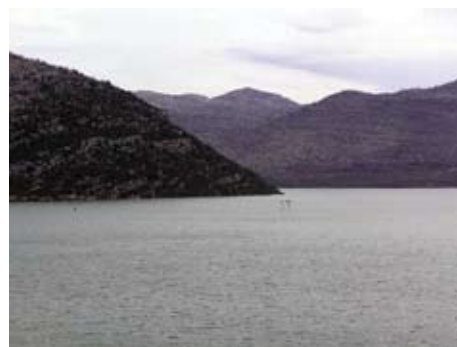
Popovo polje pod vodom