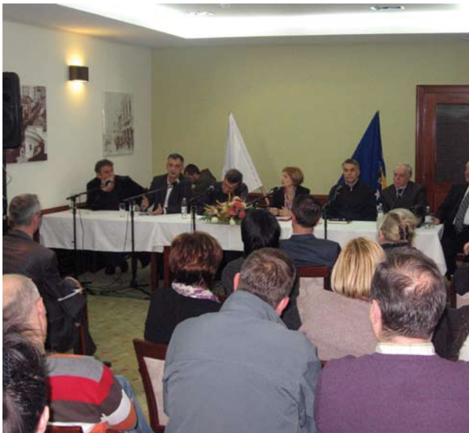
Tribina za vijećnike u hotelu Bristol u Mostaru, ožujak 2011.