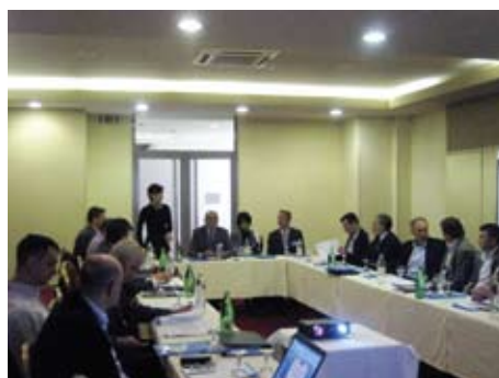
Okrugli sto, Čapljina