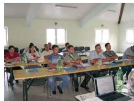
Trening - Javno zagovaranje, Ravno