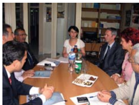
Posjeta delegacije Antalije