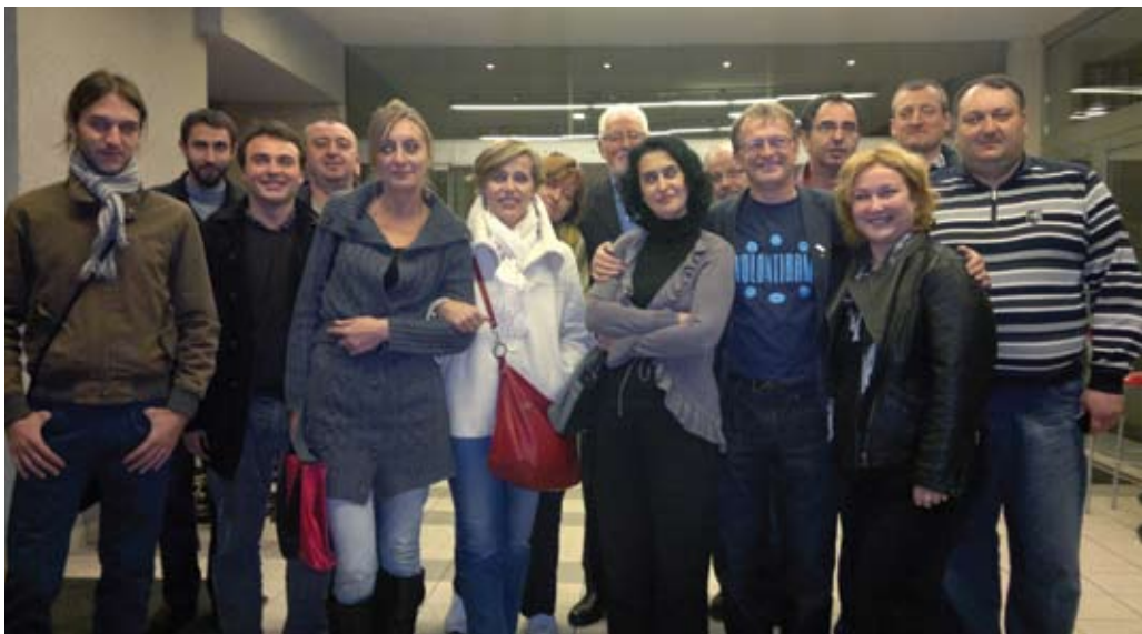
Sisak, studeni 2011.

Ovo je bila prilika za redovitu koordinaciju svih Agencija i njihove Asocijacije uključujući i vodeće partnere, ali i prilika da se pruži potpora i nađe najbolje rješenje za nastavak rada i djelovanja tri hrvatske Agencije lokalne demokratije nakon ulaska Hrvatske u Europsku uniju.