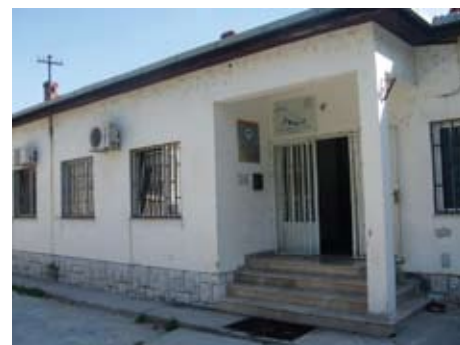
Ured LDA Mostar na novoj adresi

Sukladno tomu, LDA Mostar je uradila i preregistraciju organizacije kod Županijskog suda Hercegovačko-neretvanske županije i registrirala promjene koje su napravljene u Statutu organizacije.