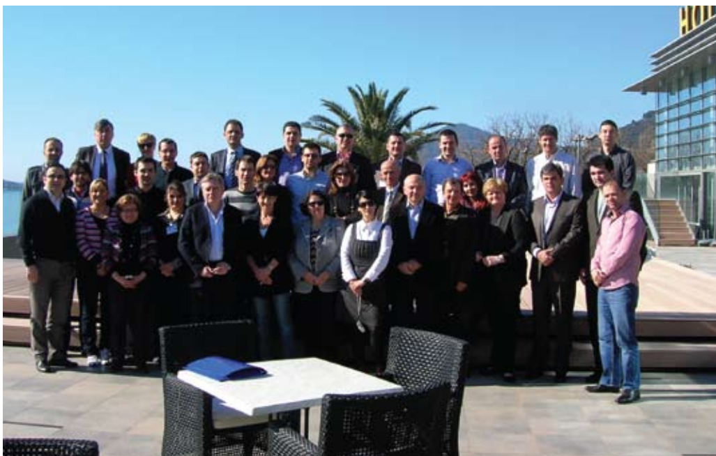
Škola lokalne demokratije Vijeća Europe, Bečići, veljača 2011.

Radionici je nazočio predstavnik LDA Mostar. Ova je Radionica pružila priliku sudionicima da saznaju više o ovom Zakonu, preprekama u njegovoj provedbi, te poslužila kao dobar okvir za poboljšanje usluga koje se pružaju građanima, budući da je u okviru LDA Mostar, kroz jedan od projekata Resursnog centra za demokratizaciju Mostar, otvoren Ured za besplatnu pravnu pomoć građanima, koji se pokazao kao jako potreban i koristan lokalnoj zajednici.