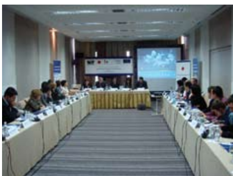
Škola lokalne demokratije Vijeća Europe, Sarajevo, travanj 2011.

• Seminar na temu „Pomirenja - žrtve rata“ u organizaciji Karitasa CRH - 27. svibnja, Omladinski kulturni centar Abrašević, Mostar.