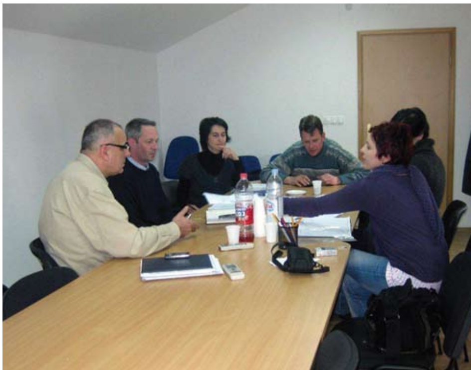
Koordinacijski sastanak partnera

5. Agencija lokalne demokratije Mostar u okviru Projekta POPoWO organizirala je u Ljubinju. 13. 7. 2011. godine trening na temu: „EU fondovi i IPA za Bosnu i Hercegovinu“. Ovo je prvi trening organiziran u okviru Projekta i imao je za cilj upoznati predstavnike općina Čapljina, Ljubinje, Ravno i Trebinje, predstavnike javnih institucija, nevladinih organizacija, udruženja lovaca i poljoprivrednih zadruga sa strukturom i uvjetima dobivanja na korištenje sredstava iz EU fondova. Neke od tema koje su obrađivane na treningu su: Instrument IPA 2007 – 2013, fondovi EU: Podrška realizaciji zajedničkih politika EU, programi zajednice, 5 komponenti IPA fondova, komponenta 1 „Podrška tranziciji i institucionalnoj izgradnji“