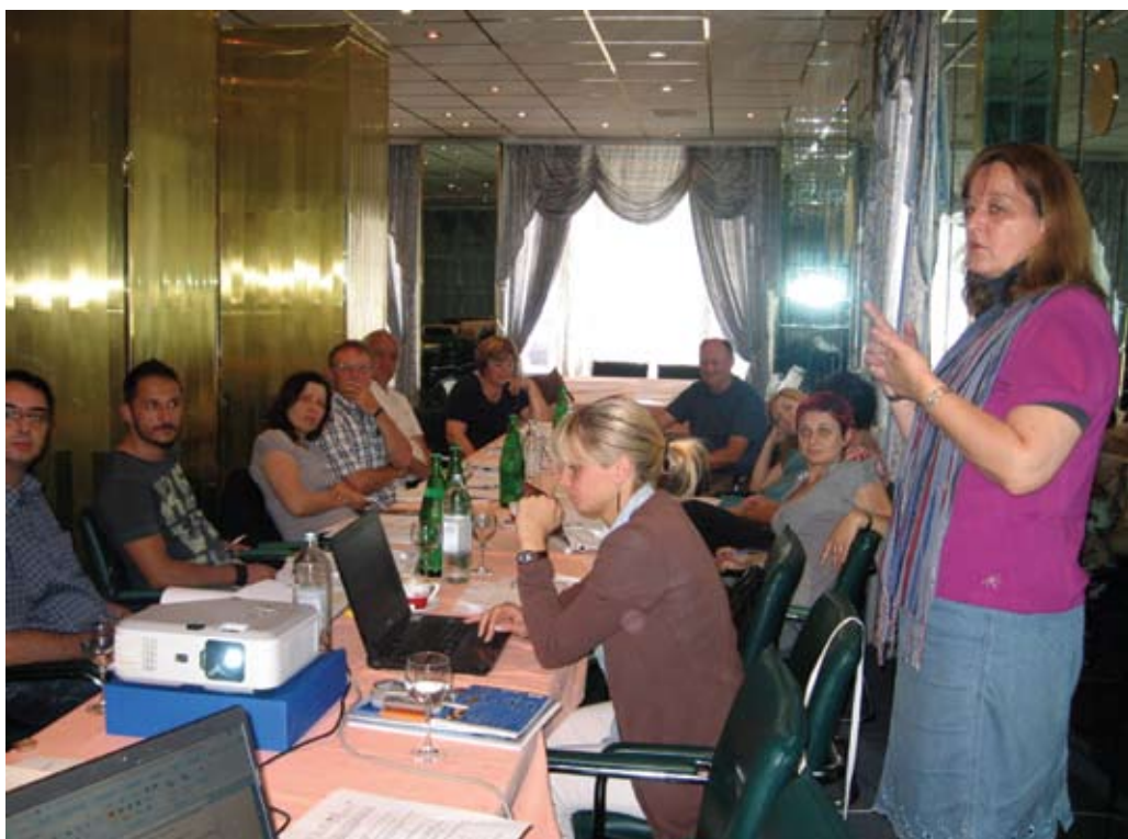
Sastanak Upravnog odbora u Mostaru, srpanj 2011.