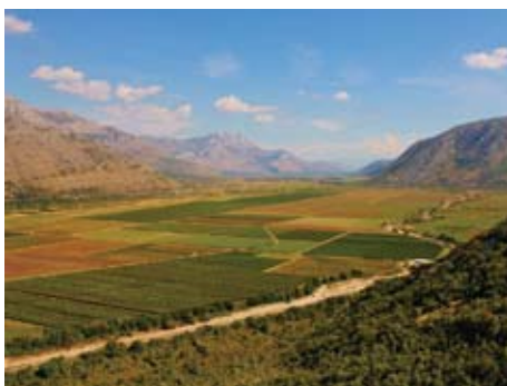
Popovo polje bez vode