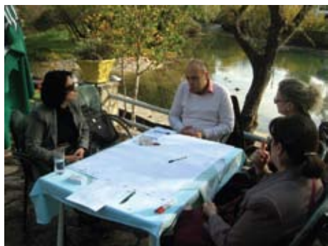
Projekt CSSP, Blagaj, studeni 2011.

09. studenoga 2011. godine, u Motelu Ada u Blagaju održana je Radionica u kojoj su sudjelovali predstavnici izvršne i zakonodavne vlasti Grada Mostara zajedno sa predstavnicima nevladinih organizacija. Cilj radionice bio je kreirati alate i mehanizme za primjenu sporazuma između NVO-a i Grada Mostara.