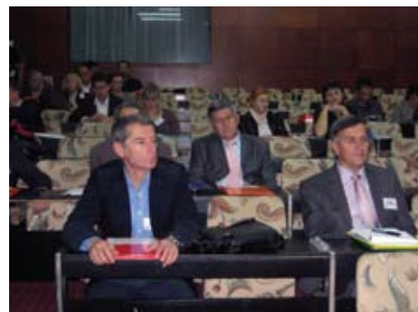
Početna konferencija Tuzla