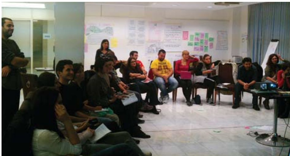
Trening za učesnike projekta

Projekt je osnažio mlade vođe, radeći kroz obuku na razvoju strategije i aktivnosti za suzbijanje rasizma, ksenofobije, diskriminacije i rodnog oblika nepoštivanja. Sudionici su upoznati s različitim priručnicima o ljudskim pravima a razgovarali su i o tome kako ih najbolje koristiti, te ih prilagoditi lokalnim kontekstima i realnosti.