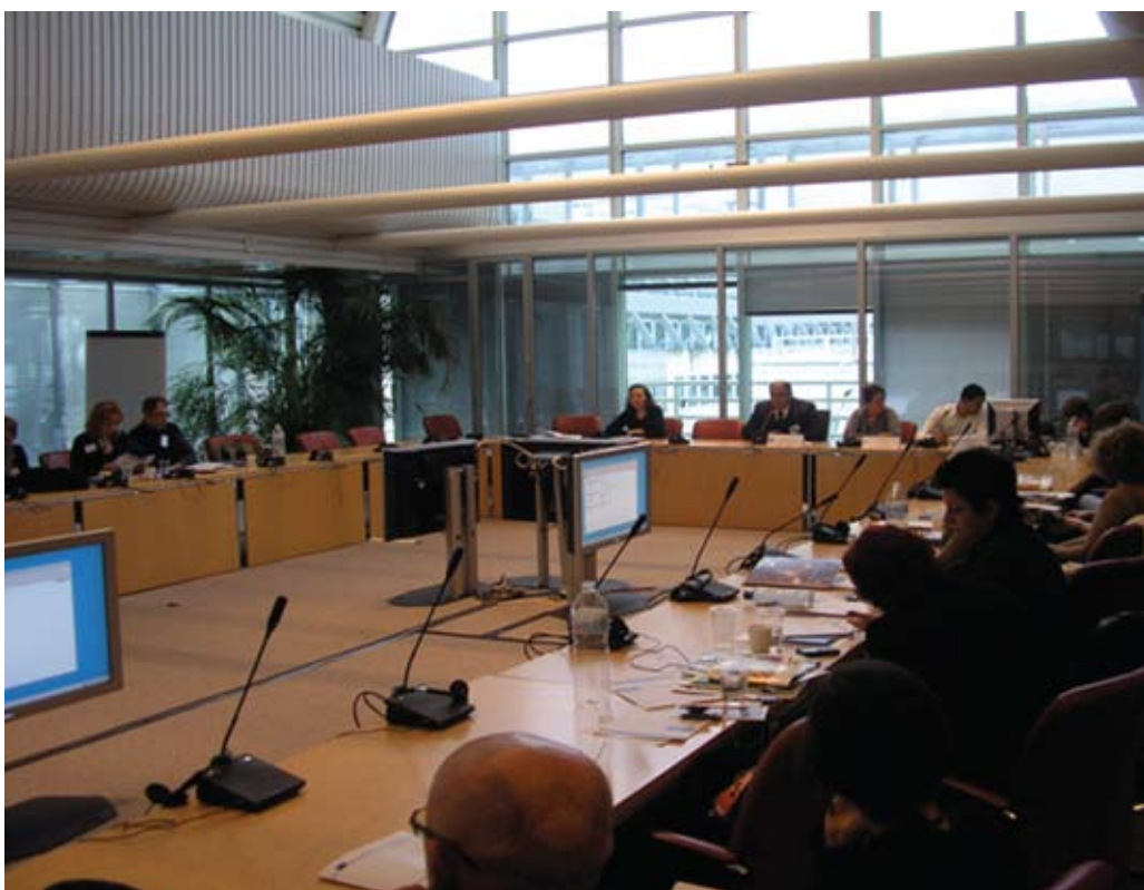
Finalna konferencija u Briselu, ožujak 2011.