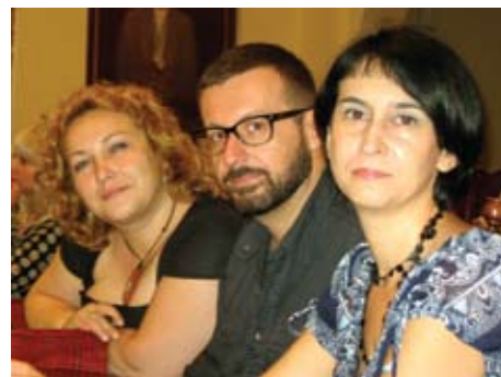
ALDA - Generalna skupština

Direktorica LDA Mostar sudjelovala je na pomenutim događajima zajedno sa predstavnicima ostalih Agencija lokalne demokratije, ALDA-e, te predstavnicima gradova i regija članova ALDA-e.