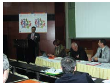
Početna konferencija Tuzla