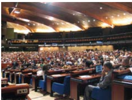
Škola lokalne demokratije Vijeća Europe, Strasbourg, srpanj 2011.