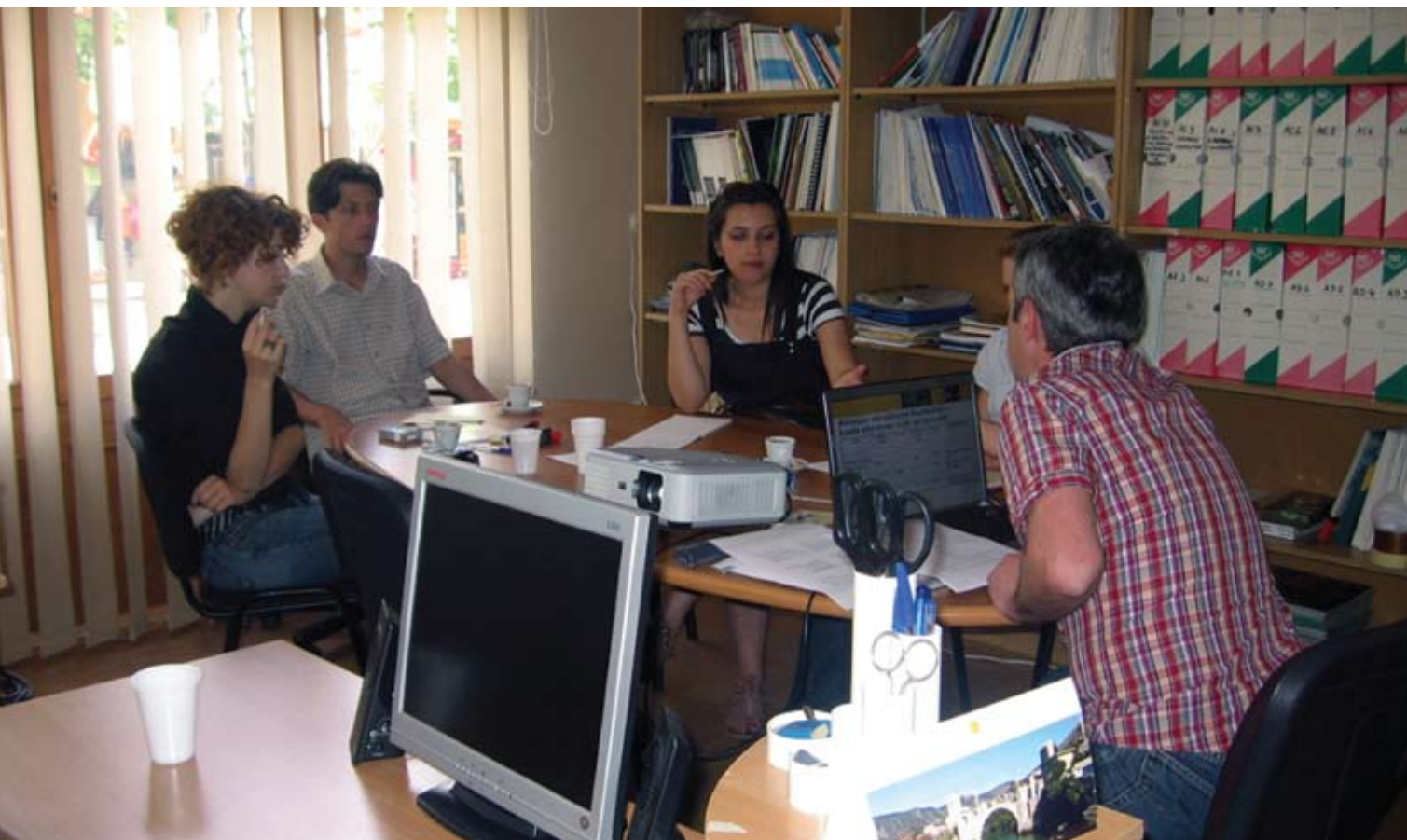
Trening za polaznike škole Mo.Start-v, lipanj 2011.

S obzirom na važnost komunikacije ovog sektora u globalnom kontekstu i njegov razvitak, kroz projekt je profesionalno osposobljena grupa mladih ljudi u području neovisnog video novinarstva koje im treba služiti kao alat za uporedbu, učenje, poticanje dijaloga i inter-kulturalne razmjene.