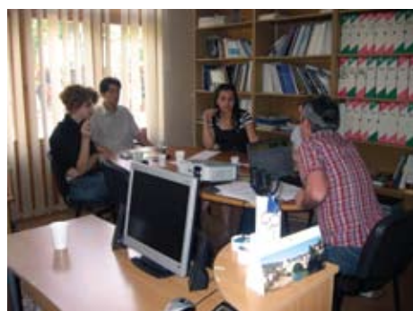
Trening za MoStar.T-V

• Generalna godišnja Skupština LDA Mostar 25. veljače 2011. godine U prostorijama NDC Mostar, LDA Mostar organizirala je 6. Generalnu skupštinu organizacije. Skupštini su nazočili svi članovi. To je bila prilika za predstavnike LDA Mostar prezentirati aktivnosti realizirane u 2010 godini, uz popratnu publikaciju „Izvešće o aktivnostima 2010.“, kao i predstaviti planirane aktivnosti za 2011. godinu. Tijekom Skupštine, članovi Upravnog odbora, predsjednik Skupštine i tajnik organizacije ponovno su jednoglasno izabrani.