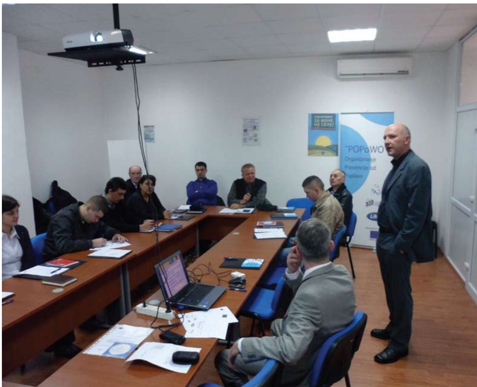
PCM trening u Trebinju, prosinac 2011.