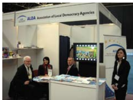
NALAS - Sarajevo, ožujak 2011.

Na ovome Sajmu gradonačelnici i izabrani predstavnici lokalnih i regionalnih vlasti potpisali su i Deklaraciju pod nazivom „Suočavanje s budućnošću lokalnih vlasti: dobra uprava, socijalna inkluzija i europske integracije“.