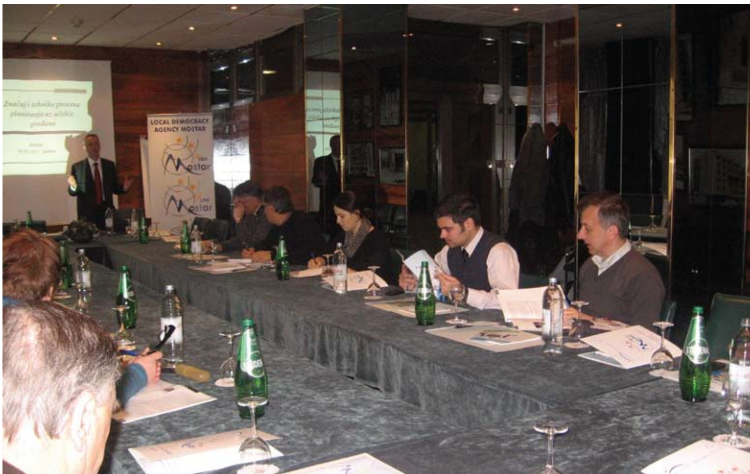
Tribina za vijećnike, Hotel Bristol u Mostaru, ožujak 2011.