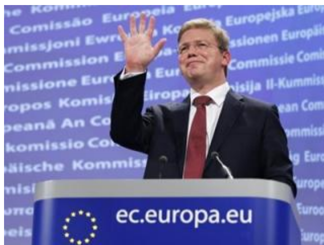
Štefan Füle, Komesar za proširenje i evropsku politiku prema susjedima

Potpisivanjem Sporazuma o stabilizaciji i pridruživanju Bosna i Hercegovina je stupila u prvi ugovorni odnos sa Evropskom unijom. S obzirom da je u pitanju sporazum mješovitog karaktera, da bi stupio na snagu mora biti potvrđen odnosno ratificiran u parlamentima svih država članica i Evropskom parlamentu. Predsjedništvo BiH je u novembru 2008. godine ratifikovalo SSP. Do završetka procesa ratifikacije u EU, na snazi je Privremeni sporazum (Interim Agreement) koji je dio SSP -a i koji najvećim dijelom reguliše pitanja trgovine i transporta između BiH i Evropske unije. Tokom tehničkih rundi pregovora najviše vremena i napora je uloženo upravo u trgovinske odredbe i liste proizvoda za koje će Bosna i Hercegovina, postepeno u periodu od 5 godina, davati carinske ustupke do potpune liberalizacije trgovine sa Evropskom unijom. Zadatak BiH je da sprovede odredbe Privremenog sporazuma i da nastavi sa svojim aktivnostima i ispunjavanjem kriterijuma za punopravno članstvo. Nakon stupanja na snagu SSP-a, slijedeći korak je podnošenje zahtjeva za članstvo u EU i sticanje statusa kandidata.